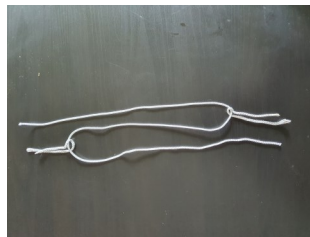
Kleine Seile in die Schlaufen